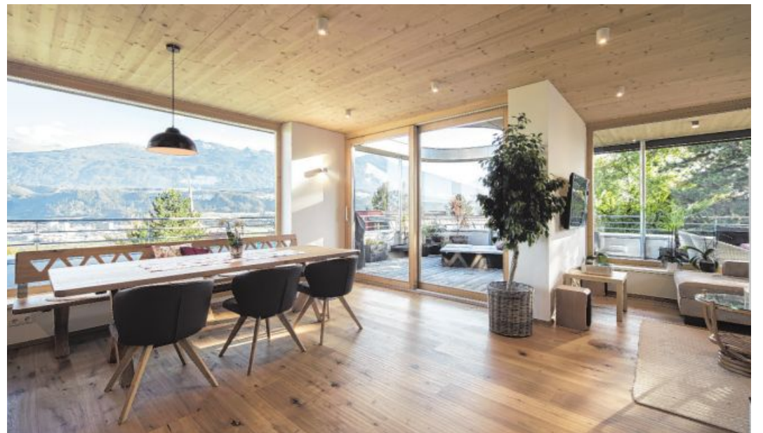
Vorgelagerte, thermisch getrennte Terrassen verlängern das Wohnen ins Freie.