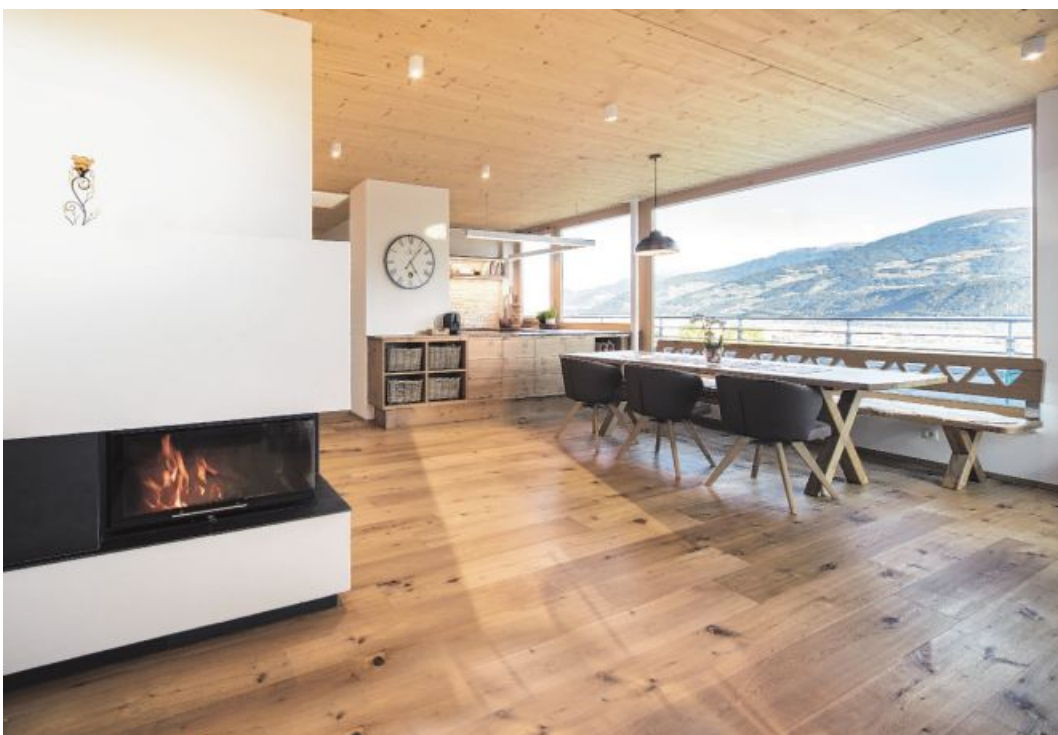
Im neuen Dachgeschoß des Wohnhauses sorgen warme Holzoberflächen und große, teilweise raumhohe Glaselemente für viel Licht sowie Atmosphäre mit Weitblick.

Die Sanierung dieses beeindruckenden Mehrgenerationenhauses wurde als ein mustergültiges Beispiel der Nachverdichtung im privaten Wohnbau unter Beibehaltung des ursprünglichen Grundrisses mit dem ET-HOUSE Award ausgezeichnet. „Dieses Projekt ist ein mustergültiges Beispiel der Nachverdichtung im privaten Wohnbau unter Beibehaltung des ursprünglichen Grundrisses. Die flexible Nutzung zweier Ebenen verdeutlicht die Auseinandersetzung der Planer mit dem Thema Raum.“