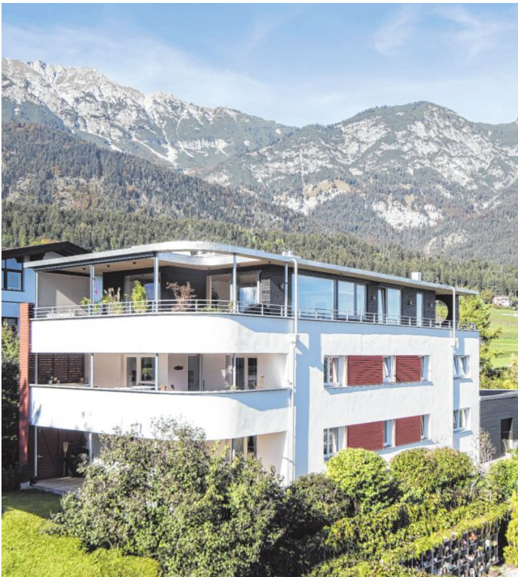
Ziel des Umbaus und der Aufstockung waren drei großzügige Wohneinheiten mit ebenso großzügigen Ausblicken.

Was einst ein schlichtes Wohnhaus aus den 1980er-Jahren war, wurde zum Ausgangspunkt einer eindrucksvollen Verwandlung. Das Gebäude erfuhr eine behutsame wie konsequente Erweiterung.