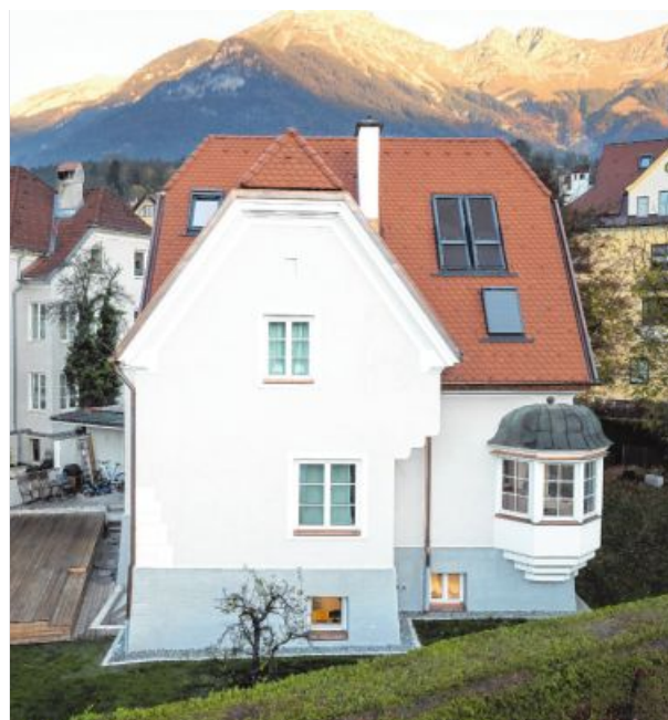
Äußerlich wurde das Haus kaum verändert. Neu sind die Stiege, die vom Garten aus die Veranda erschließt, sowie einige Dachfenster. Die Stiege im Inneren wurde ins Dachgeschoß weitergebaut.