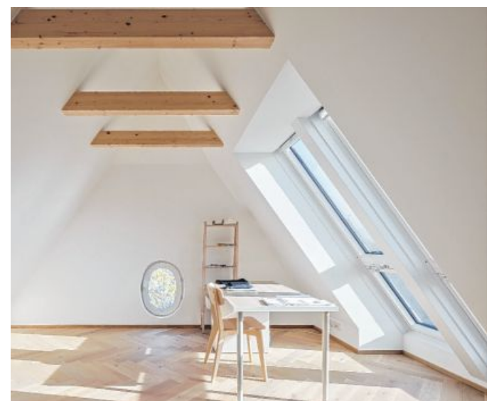
Bis unter den Dachstuhl offen sind die Räume ganz oben mit ihren zu Minibalkonen ausklappbaren Fenstern. In der zum Teil des großen Wohnraums gewordenen Veranda steht der Esstisch.

Aus mehreren kleinen Zimmern wurde im Erdgeschoß ein rund 40 Quadratmeter großer und drei Meter hoher Raum, dessen Teil auch die Veranda ist. In ihr steht der große Esstisch, der Küchenblock wird zum Raumteiler, daneben „kochen“ der kleine Sohn und seine Schwes-