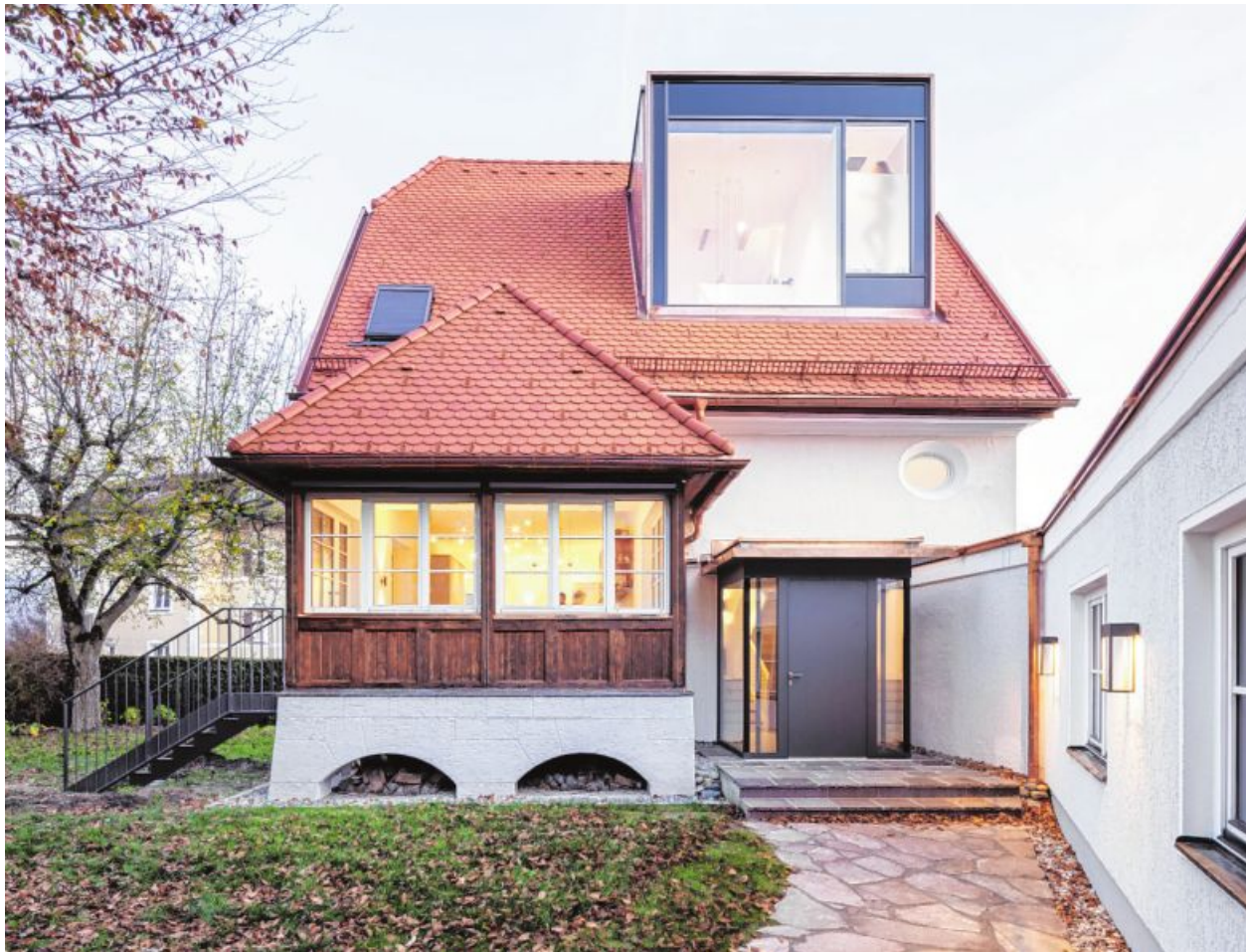
In das Dach implantiert wurde eine in Kupferblech gehüllte Gaube. Der Garagenanbau stammt aus den 70er-Jahren.

Im Inneren wurde der Umbau praktisch zum Rohbau.